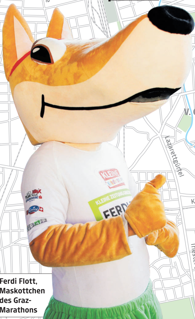
Ferdi Flott, Maskottchen des Graz-Marathons